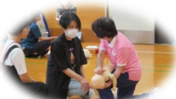
講座の様子(幼児安全法)