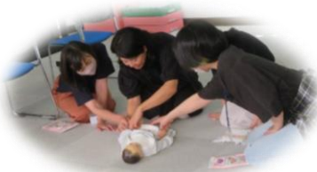
講座の様子(発育・発達)